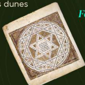
Femme Juive de Tinghir 20 ème Siècle

Cette province a aussi été le théâtre de grandes batailles contre l'armée française au temps du protectorat. On peut citer la bataille de Bougafer où la tribu des Ait Atta conduite par Feu Assou Oubasslam s'est grandement illustrée. La province a tellement de trésors à dévoiler. C'est une étape importante du voyage vers les dunes du désert de Merzouga.